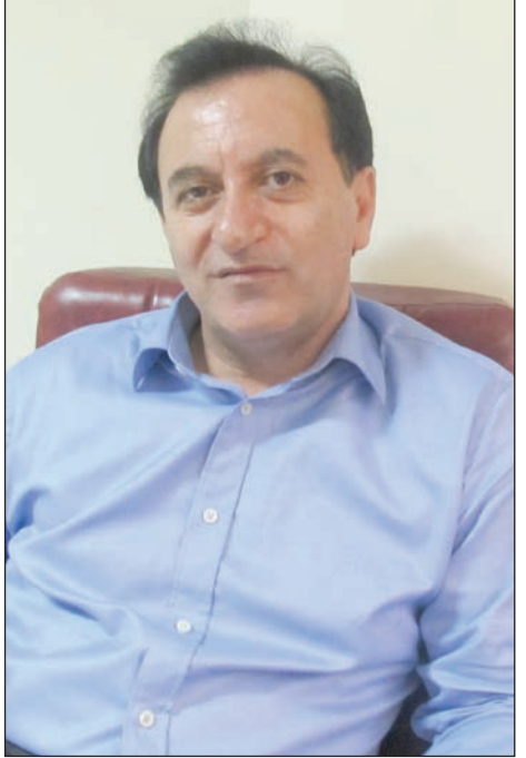
وضعیت فعلی روابط عمومی‌های کشور را چگونه ارزیابی می‌کنید؟

متأسفانه در کشورمان نگاه به روابط عمومی غیر تخصصی است و خیلی‌ها نمی‌دانند که روابط عمومی یک دانش است و باید فارغ‌التحصیل این رشته وارد این حرفه شوند. بسیاری می‌پندارند، کسانی که آداب معاشرت بهتری دارند می‌توانند کار روابط عمومی کنند، این تفکر در مدیران نیز به چشم می‌خورد و به طور مثال در آگهی‌های استخدامی نیز می‌گویند که به یک نفر با روابط عمومی خوب نیازمندیم. در صورتی که خودشان هم نمی‌دانند کسسه یک روابط عمومی خوب چه کاری باید انجام دهد؟