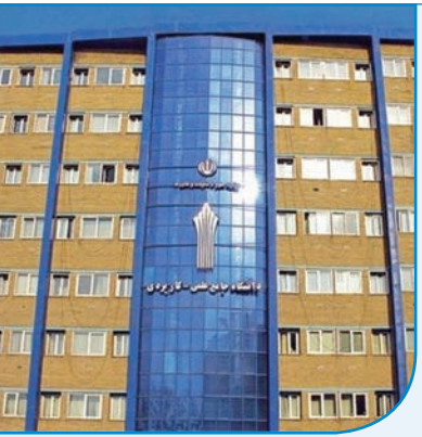
زمان ثبت‌نام در دوره مهندسی فناوری و دوره کارشناسی حرفه‌ای بهمن‌ماه سال ۱۳۹۴ دانشگاه جامع علمی- کاربردی تا

به گزارش فارس، مقاضیان دوره با آزمون کارشناسی ارشد دانشگاه آزاد اسلامی می‌توانند تا پایان روز جمعه ۳۰ بهمن‌ماه با مراجعه به سامانه مرکز سنجش و پذیرش به نشانی www.azmoon.org