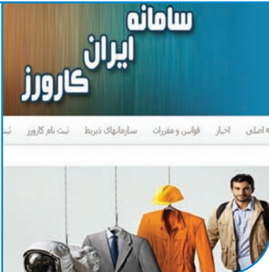
سامانه ایران کارورز

تدبیر و امید و وزارت تعاون، کار و رفاه اجتماعی برای اشتغال دانش‌آموختگان دانشگاهی اجرا می‌شود، افزود: کارورزی می‌تواند به فارغ‌التحصیلان، مهارت‌های شغلی مهمی را همانند برقراری ارتباط، تعهد کاری، وقت‌شناسی، حل مسئله، کارگروھی، خودمدیریتی، برنامه‌ریزی و سازماندهی و آشنایی با فناوری را بیاموزد که امروزه برای شاغل شدن بسیار واجب و ضروری هستند.